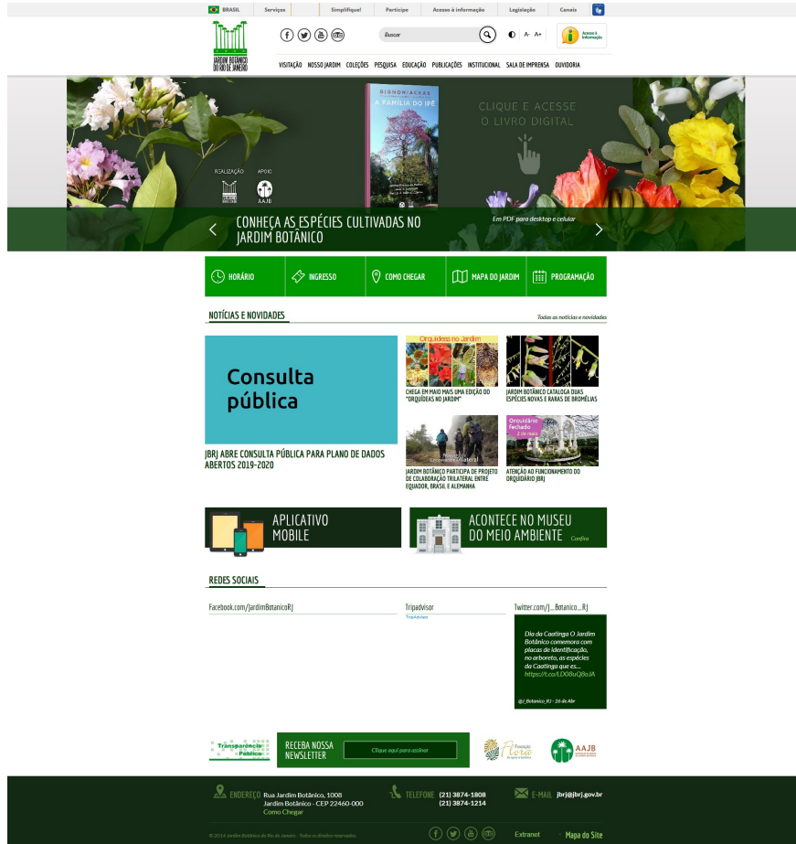
Figura 4 - Chamada para consulta pública no sítio do JBRJ na Internet

No detalhamento da chamada, foi estipulado o prazo de 30 dias para o recebimento das contribuições e sugestões (Figura 5).