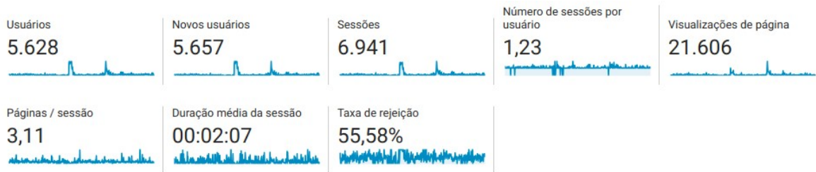
Figura 2 - Métricas de acesso ao Ckan - 03/07/2017 a 25/11/2018

repositório para o período de 03 de julho de 2017 a 25 de novembro de 2018: